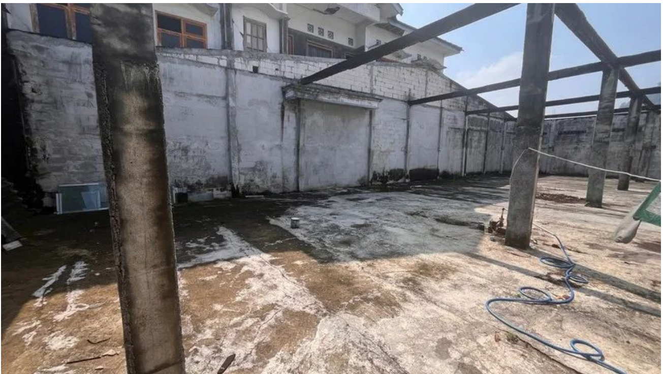
Foto 2 - Disewakan Gudang Jalan Raya Piyungan Bantul Dekat Akses Tol