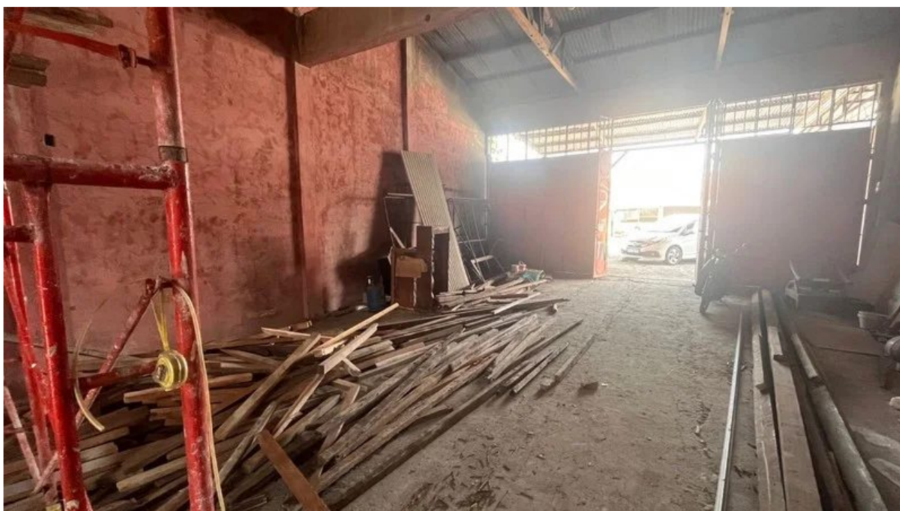
Foto 6 - Disewakan Gudang Jalan Raya Piyungan Bantul Dekat Akses Tol