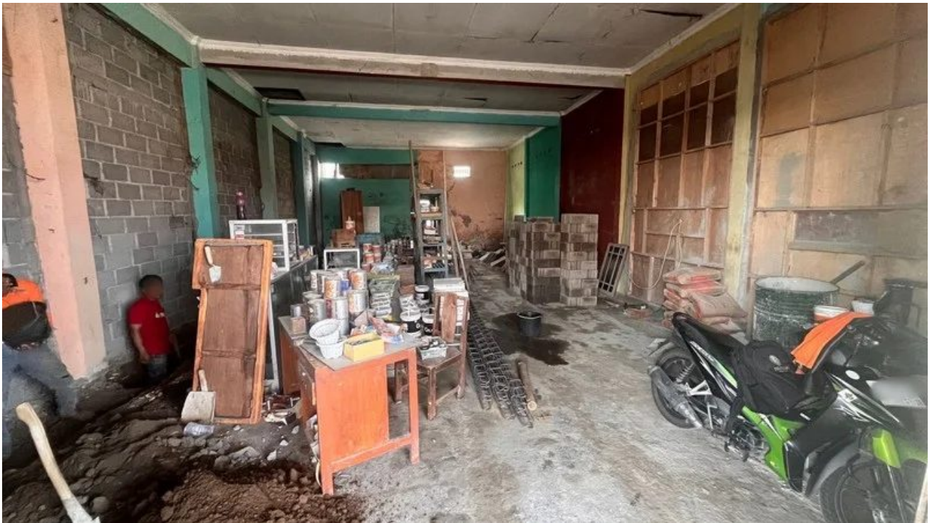
Foto 3 - Disewakan Gudang Jalan Raya Piyungan Bantul Dekat Akses Tol