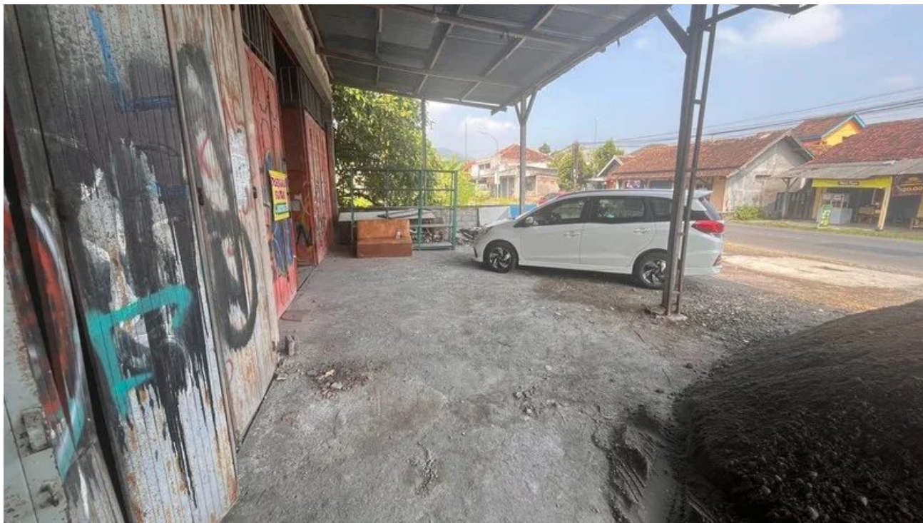
Foto 5 - Disewakan Gudang Jalan Raya Piyungan Bantul Dekat Akses Tol