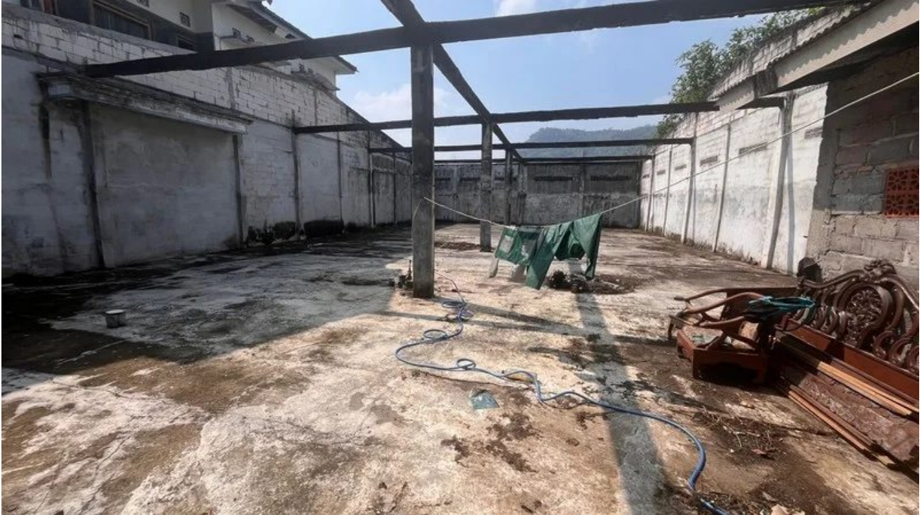
Foto 1 - Disewakan Gudang Jalan Raya Piyungan Bantul Dekat Akses Tol