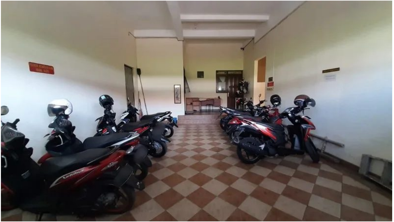
Foto 3 - Dijual Kost Aktif 32 Kamar Seturan Caturtunggal Sleman