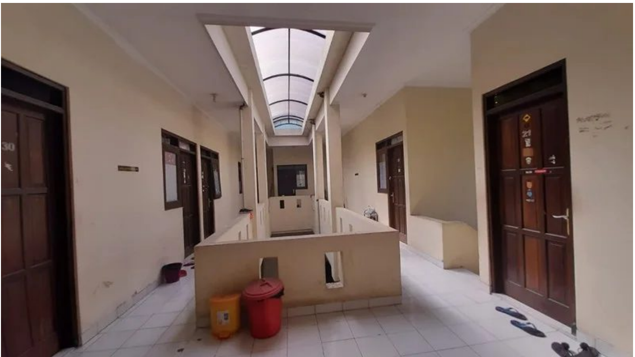
Foto 2 - Dijual Kost Aktif 32 Kamar Seturan Caturtunggal Sleman