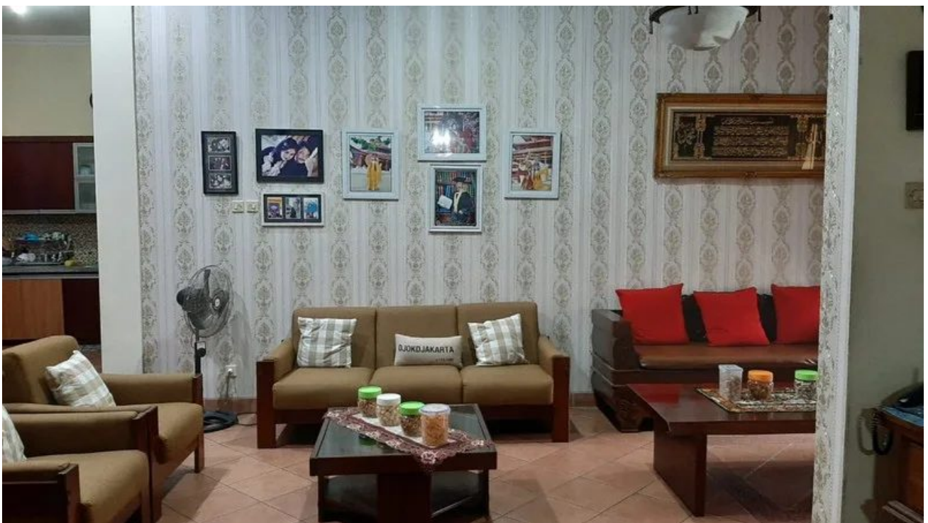
Foto 8 - Dijual Kost Aktif 32 Kamar Setoran Caturtunggal Sleman