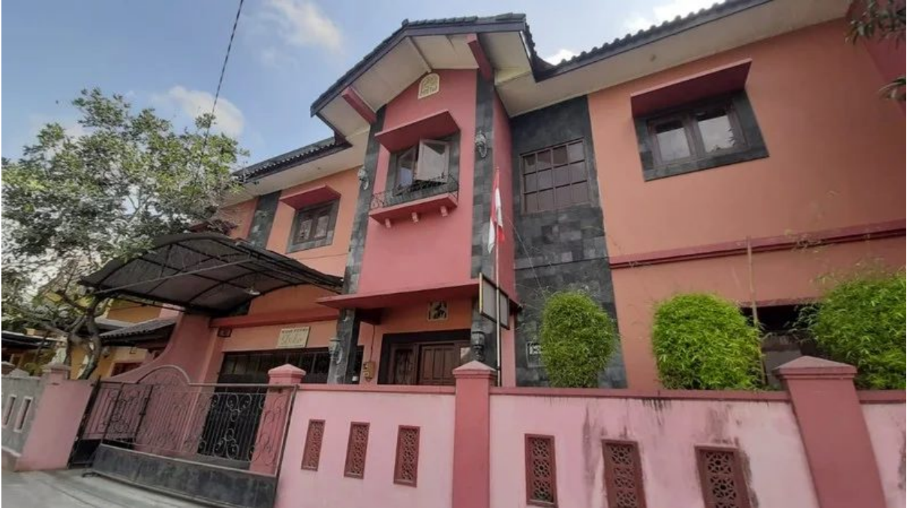
Foto 1 - Dijual Kost Aktif 32 Kamar Seturan Caturtunggal Sleman