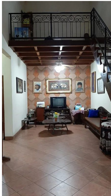
Foto 7 - Dijual Kost Aktif 32 Kamar Setoran Caturtunggal Sleman