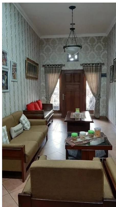
Foto 10 - Dijual Kost Aktif 32 Kamar Seturan Caturtunggal Sleman