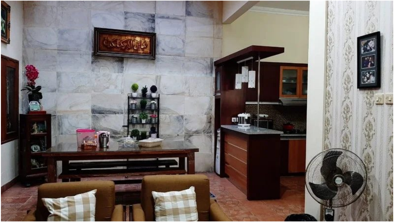
Foto 5 - Dijual Kost Aktif 32 Kamar Setoran Caturtunggal Sleman